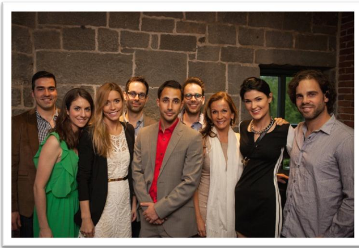
Le comité organisateur du Cercle 179