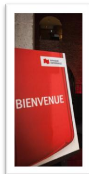
La Banque Nationale Présentateur de l'événement