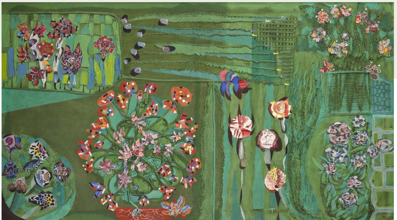
ALFRED PELLAN, JARDIN VERT, 1958, HUILE SUR Poudre CELLULOSIQUE SUR TOILE, 104,6 X 186,3 CM, COLL. MNBAQ

Le donateur se verra aussi offrir une reproduction à l'identique produite pour son usage corporatif dans ses propres locaux. Finalement les bâtisseurs ayant concrétisé cet engagement pourront tenir sans frais un événement privé au Musée à l'intention des collaborateurs ou de leur réseau d'affaires.